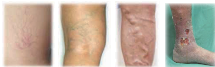
血管がクモの巣状に見える 血管が網目状に見える 血管がコブの様に見える 皮膚のただれが見える